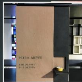
Verschlussplatte für Einzelgrabstätte